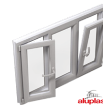
Draai- / kiepraam