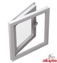
Naar buiten openend raam