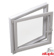
Naar binnen openend raam