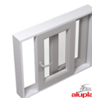
Hef- / schuifpui